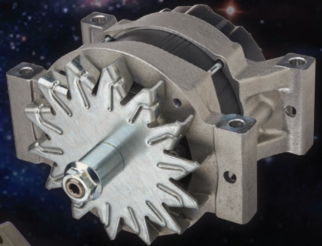
Diamond Power A200