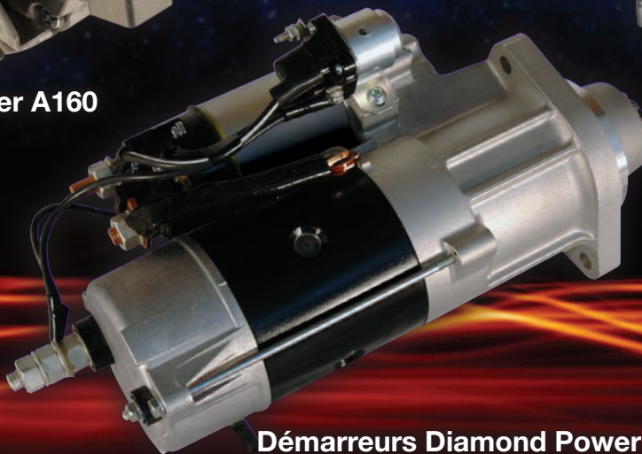
Démarreurs Diamond Power